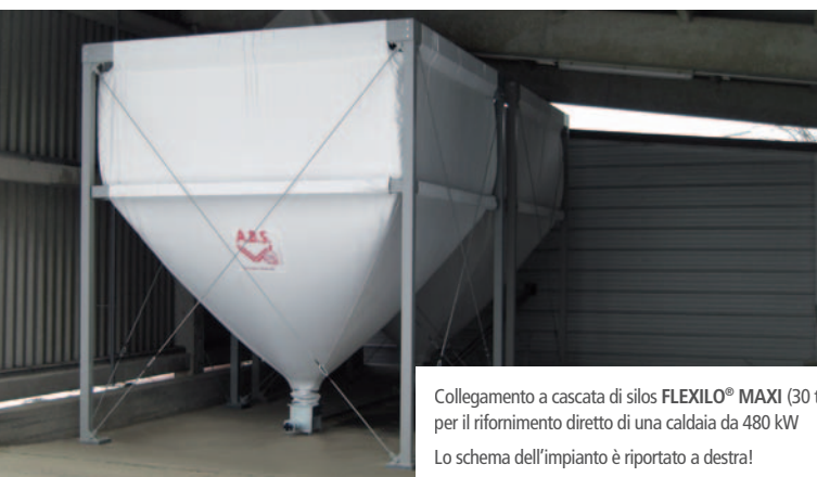
Collegamento a cascata di silos FLEXILO® MAXI (30 t) per il rifornimento diretto di una caldaia da 480 kW Lo schema dell'impianto è riportato a destra!