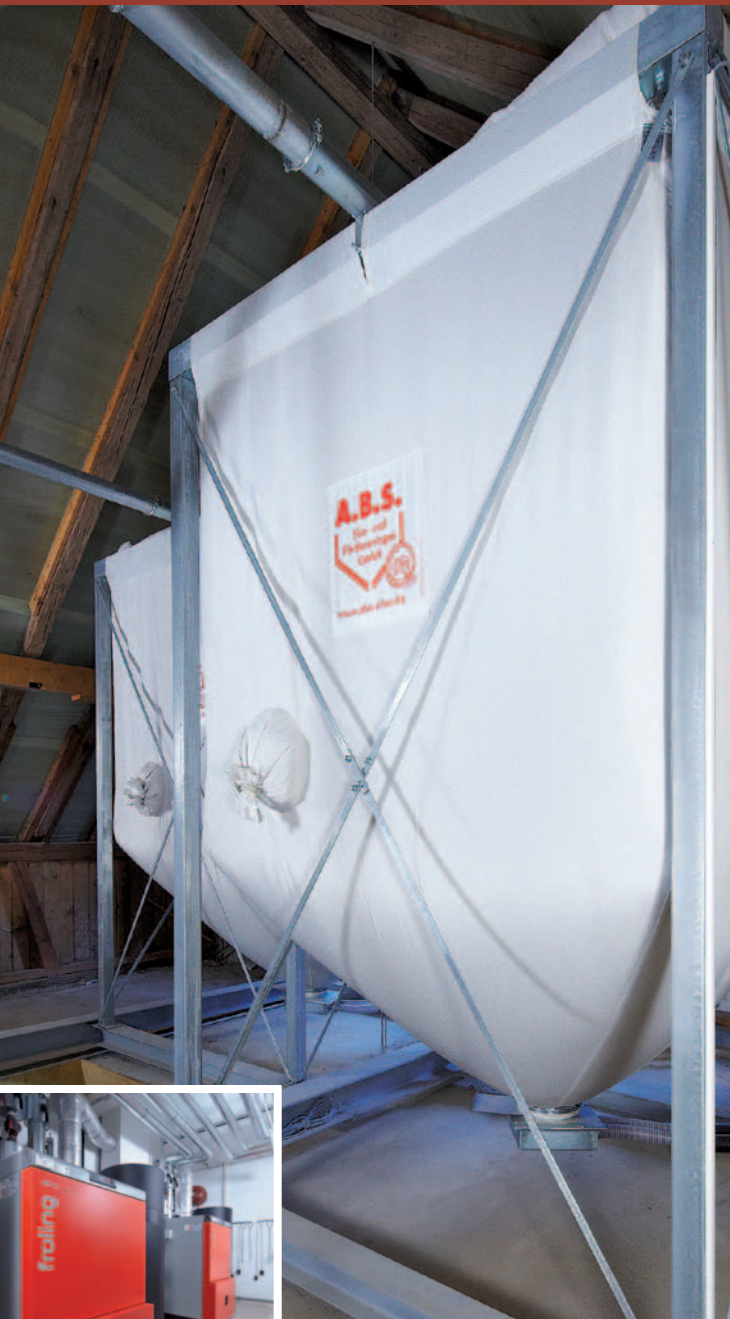
FLEXILO® MAXI per due caldaie a pellet da 48 kW ciascuna in un sottotetto